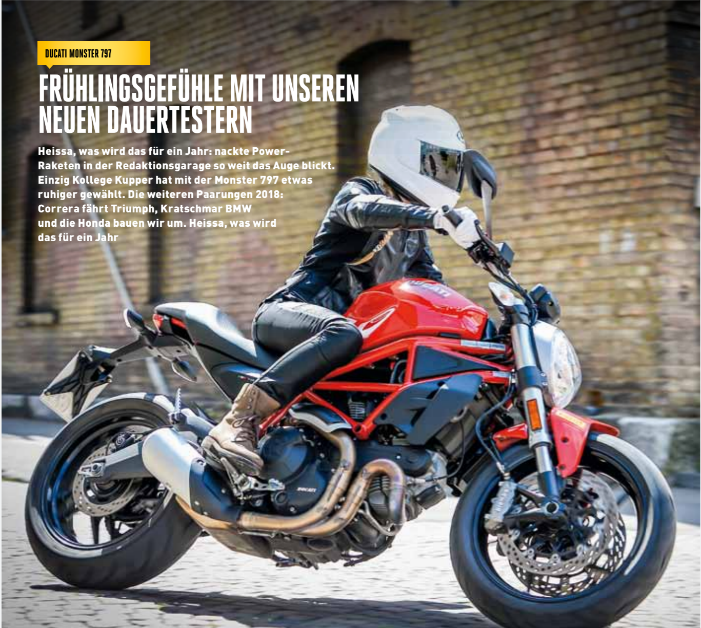
Text: JENS KRATZSCHMAR

Heissa, was wird das für ein Jahr: nackte Power-Raketen in der Redaktionsgarage so weit das Auge blickt. Einzig Kollege Kupper hat mit der Monster 797 etwas ruhiger gewählt. Die weiteren Paarungen 2018: Corraera fährt Triumph, Kratschmar BMW und die Honda bauen wir um. Heissa, was wird das für ein Jahr