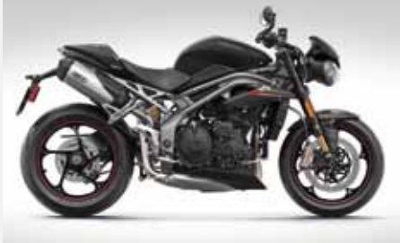
TRIUMPH SPEED TRIPLE RS

AUSSER DER MONSTER 797 WERDEN UNS FOLGENDE MOTORRÄDER DURCHS JAHR BEGLEITEN: