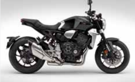
HONDA CB 1000 R