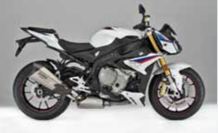
BMW S 1000 R

K aum ist der Transporter wieder geschlossen, schon rollt der erste Dauertester 2018 in die Werkstatt: die Ducati Monster 797.