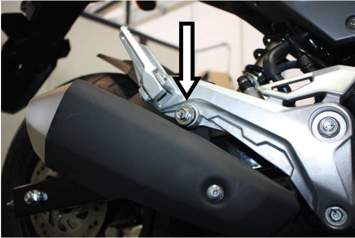
Svitare la vite di fissaggio marmitta Unscrew the screw shown above