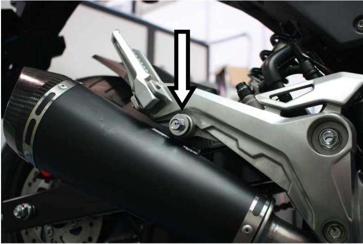
Innestare il terminale e fissare l'attacco alla pedana Fit Arrow silencer and secure it to the bracket