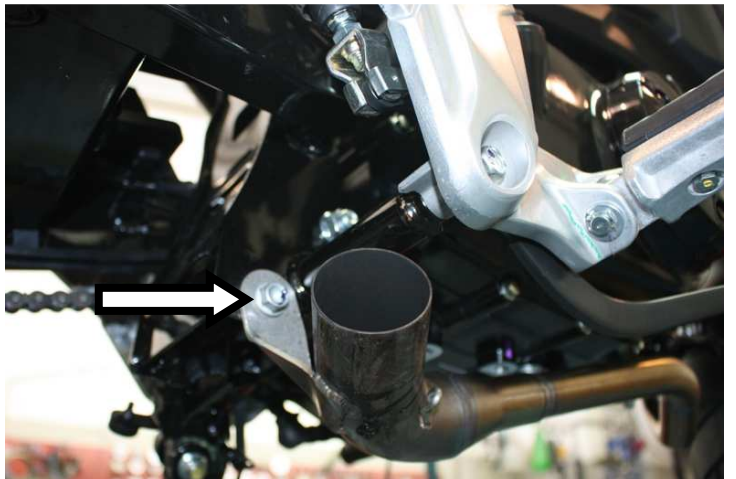
Fissare senza stringere completamente l'attacco del collettore al telaio Secure the mid-pipe welded mount to the frame. Do not tighten in this phase