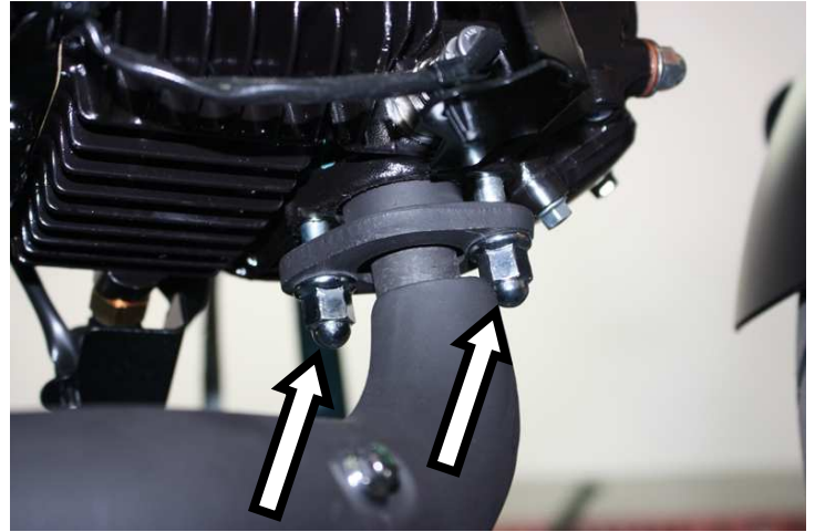
Svitare i dadi dai prigionieri del cilindro Remove the bolts securing the collector to the cylinder