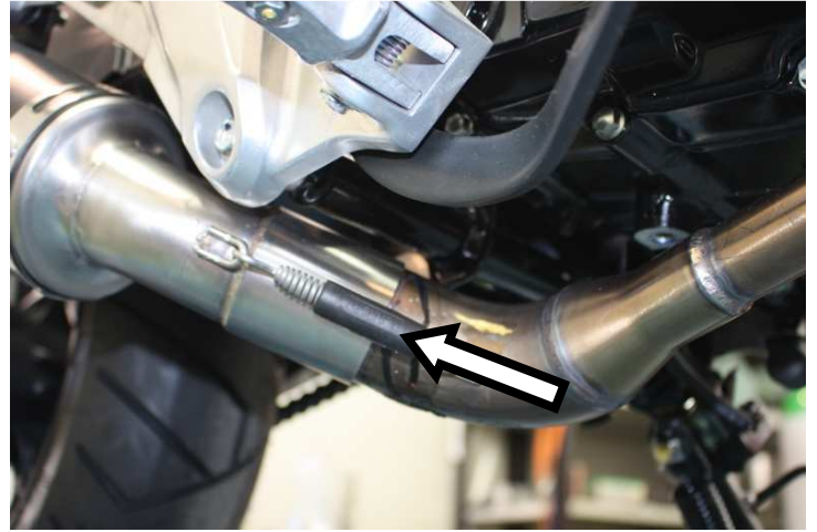
Ancorare la molla e serrare definitivamente il collettore Secure the spring and tighten the collector to the cylinder