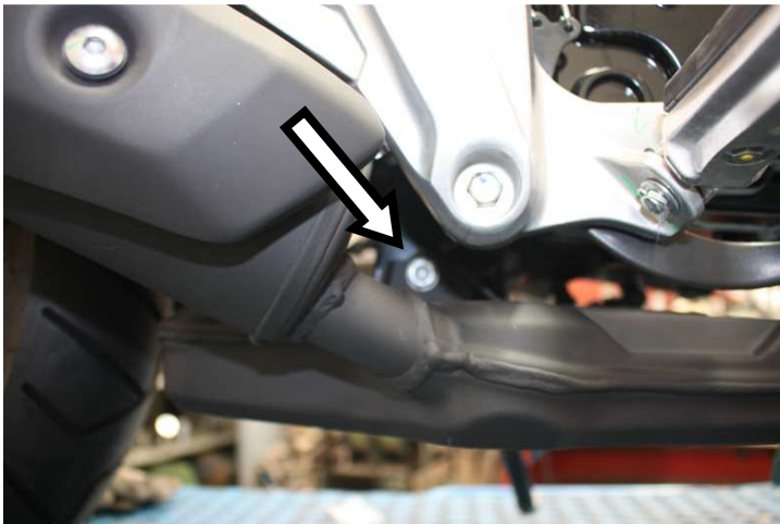
Svitare le viti di fissaggio raggruppamento (una per lato) e rimuovere lo scarico originale Unscrew the screws of the manifold (one for each side) and remove the original exhaust